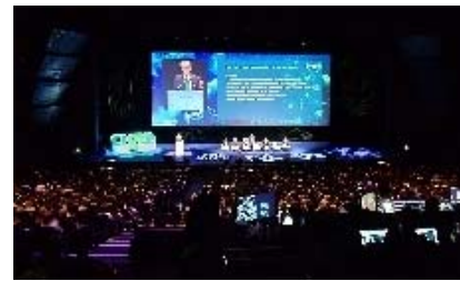
2024 年パリ大会 開会式の様子