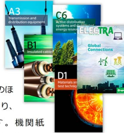
CIGRE SC 国内分科会の構成